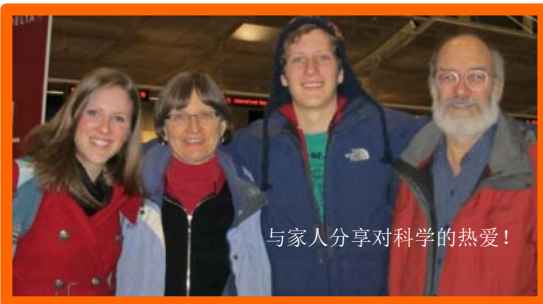
与家人分享对科学的热爱!