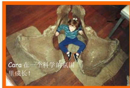
Cara 在一个科学的氛围里成长!